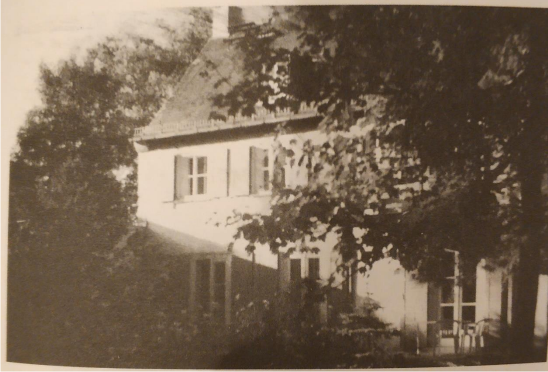
EK-A: Bizim Radyo Binası

Kaynak: Sertel, Yıldız. (2008). Nazım Hikmet ile Serteller.