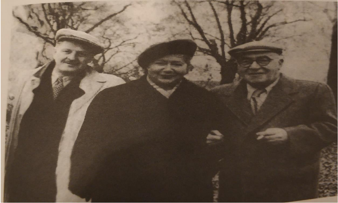
EK-B: Nazım Hikmet- Sabiha Sertel- Zekeriya Sertel