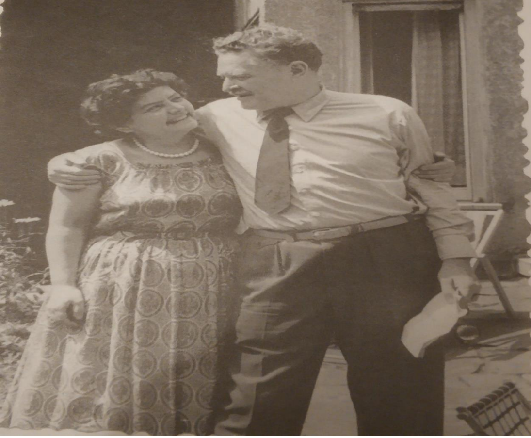
EK-C: Nazım Hikmet ve Anjel Açıkgöz

Kaynak: Güneş, M. Melih. (2017). Suyun Şavkı: Leipzig’de Bir Aile ve Nazım Hikmet, s.152.