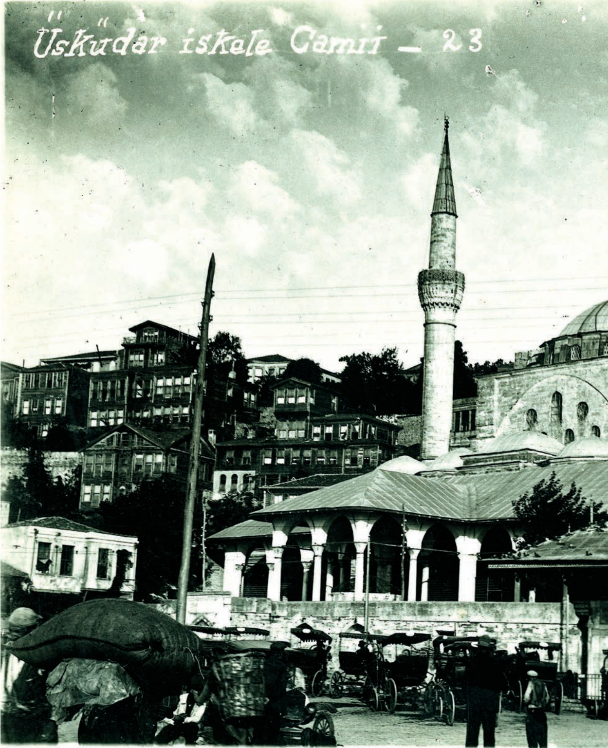
Mihrimah Sultan Camii ve III. Ahmed Çeşmesi