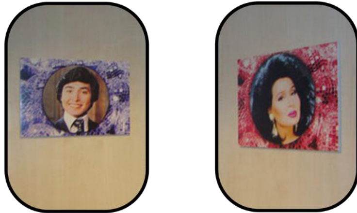
Şekil 9: Bülent Ersoy'un "Erkek" ve "Kadın" Tasvirleri Üzerinden Tuvalet Levhaları