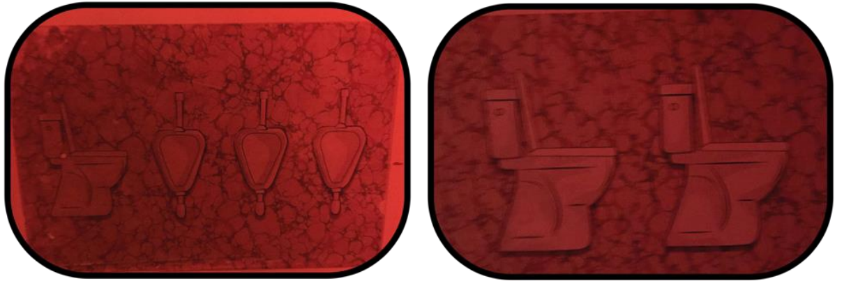
Şekil 11: LGBTI+ Dostu ve Boşaltım Araçları (Klozet ve Pisuar) Üzerinden Tasarlanan Tuvalet Levhası