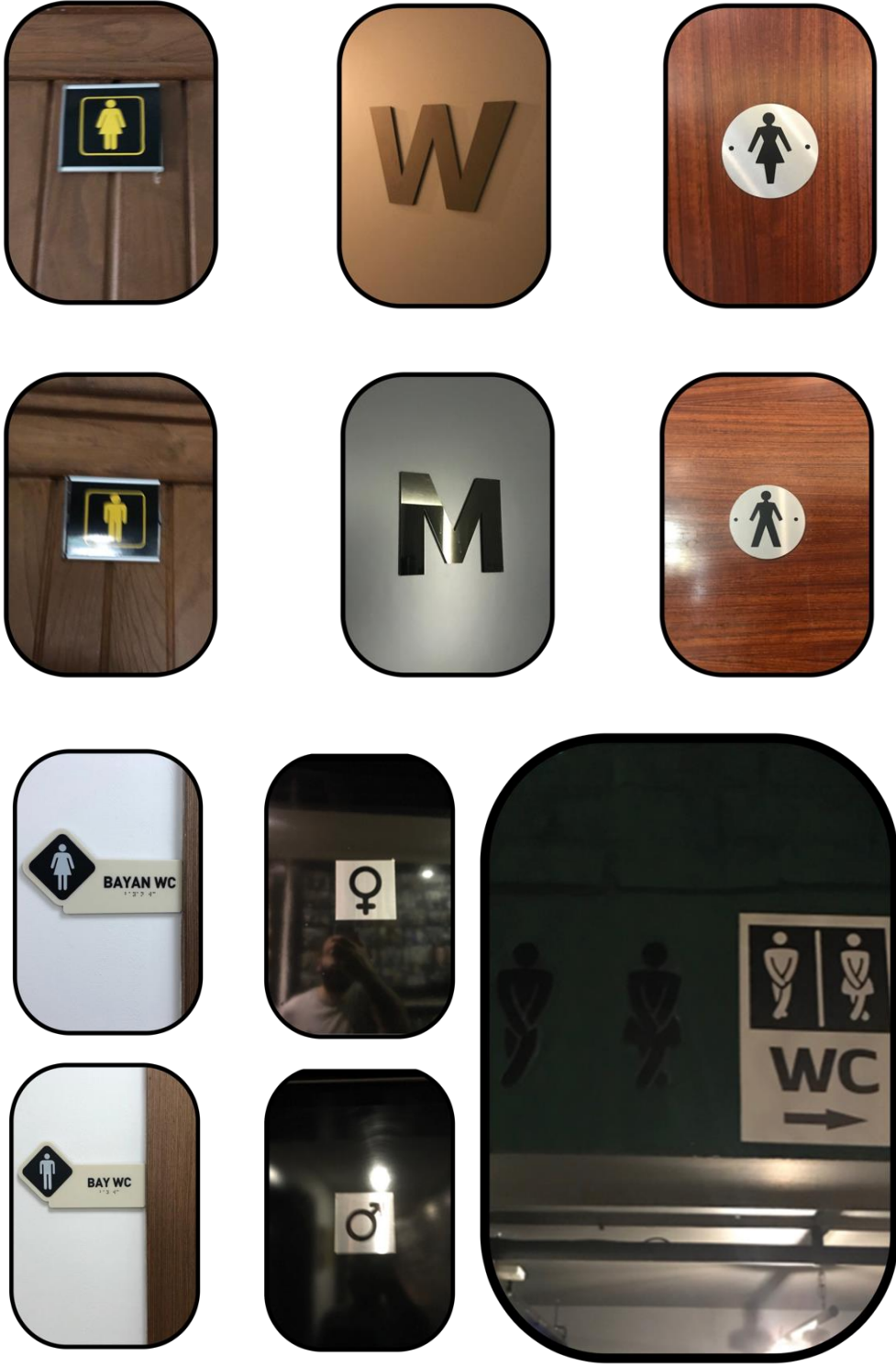
Şekil 3: En Çok Karşılaşılan (Klasik) Tuvalet Levhaları