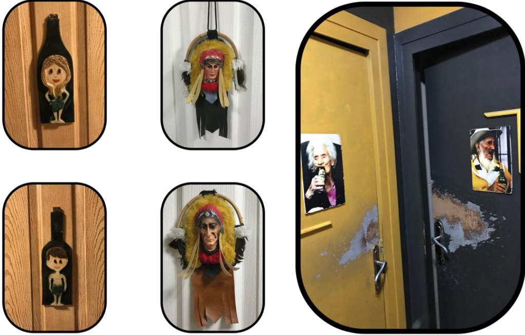
Şekil 4: Çeşitli Tuvalet Levhaları

...Klasik grafikler geliyor aklıma: bir etek giymiş, Cin Ali gibi, onun kadın olduğunu gösteren, bir işte hani erkek silueti sadece olan tabelalar var. Ya da ünlülerin resimleri: birinde Marilyn Monroe birine David Bowie var. Bazen hiç anlamadığın işaretler oluyor. Şapka veya pipo var mesela, Kadıköy’de XXX miydi? Bakıyorum, şapka kadın şapkasına benzemiyor. Pipo da yani işte... Ayırt edemediğim zamanlar oluyor... (Heteroseksüel Kadın, İşletmeci-2 Görüşmeci)