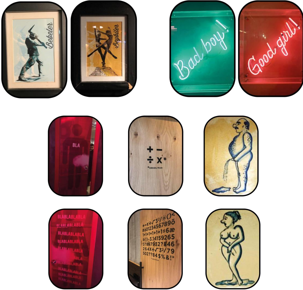
Şekil 7: Cinsiyet Odaklı Yargı İçeren Tuvalet Levhaları

Erkek tuvaletleri levhalarına bakıldığında, temel olarak “kadına ait olan her şeyden kaçma” eğiliminin olduğunu görülmektedir. Bourdieu (2015) da erkekliğin inşa sürecini, diğer erkeklerin şahitliğinde “kadın olmamak” üzerinden beslendiğini belirtmektedir (s. 71). Erkekliğin yeniden inşası üzerine düşünürken hem kadın hem erkek tuvaletleri sembollerine bakmak önemlidir. Kandiyoti (1997) erkekliği tanımlarken “iktidar ile bağlantılı olarak” erkeklerin kadınlarla ilişkilerini sürdürmeyi hedefledikleri toplumsal bir yapılanma şekli tanımını yapmaktadır (, s. 75). Erkek tuvaletleri, “kadın olmama” üzerine inşa edilir. Bu sadece biyolojik olarak kadınlarla ilgili değil, aynı zamanda “yeterince erkek olmayan” bütün cinsiyet kimliklerini de hedef alır. Erkekler tuvaleti levhaları homofobik görsellerin de kullanıldığı alanlar