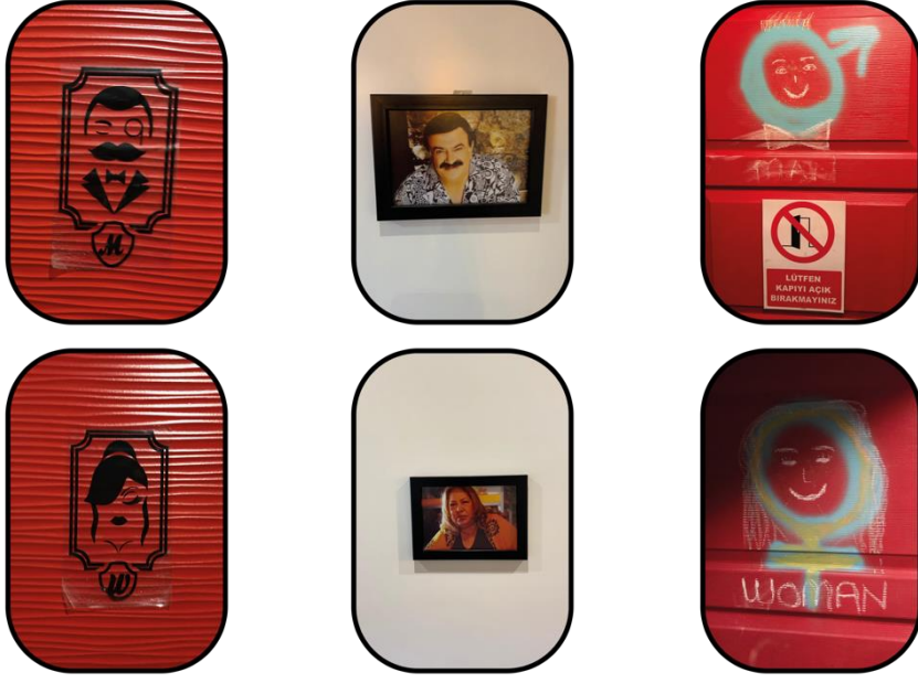
Şekil 5: "Daha Kadınsı" ve "Daha Erkeksi" Tuvalet Levhaları

İnce kadın bedeni ve kalın erkek bedeni ile toplumsal roller üzerine de odaklanan çizimlere rastlanmaktadır. Kırmızı gül veren ve sigara içen erkek görseli ve selfie çeken, büyük dudaklı ve göğüsleri büyük olan kadın görseli bir diğer dikkat çekici örnektir: