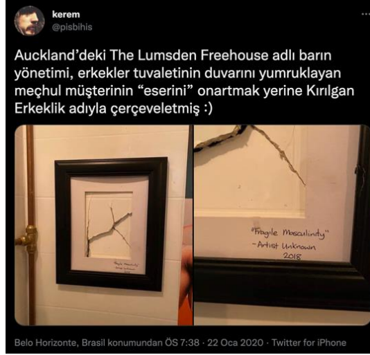
Şekil 2: Auckland The Lumsden Freehouse Mekan Tuvaleti: Kırılğan Erkeklik Eseri

Kamusal tuvaletlerin homososyal alanlar olması güvenlik, şiddet ve vandalizm ile ilgili gerçek pratik kaygıları da göz önünde bulundurmaya gerektirir. Şiddetin farklı şekillerinden biri de tacizdir. Bir başka görüşmeci ise, erkekler tuvaletinde, erkeklerin “kadın bedenini metalaştırması” şahitliğinden bahseder, taciz dinlemekten kaynaklı rahatsızlığını anlatır: