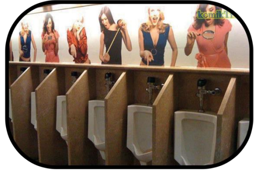
Şekil 14: Erkekler Tuvaletinden Pisuar ve Lavabo Örnekleri

Derinlemesine görüşmelerde pisuarlar ile ilgili olarak da görüşmeciler farklı perspektiflerden aktarımlar yapmışlardır. Pisuarın varlığından rahatsızlık duyan ve bu rahatsızlığın pratik unsur açısından tuvalet habitusunu etkilediğini ifade eden görüşmeciler vardır: