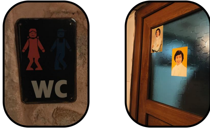
Şekil 8: Ortak Tuvalet ve Bülent Ersoy Fotoğrafi

Bu konuda Cavanagh çift cinsiyetli tabelaların, trans veya cinsiyet değişkeni olanlar için erişime engel teşkil ettiğini savunur (Cavanagh'dan aktaran Bangor Daily News, 2011).