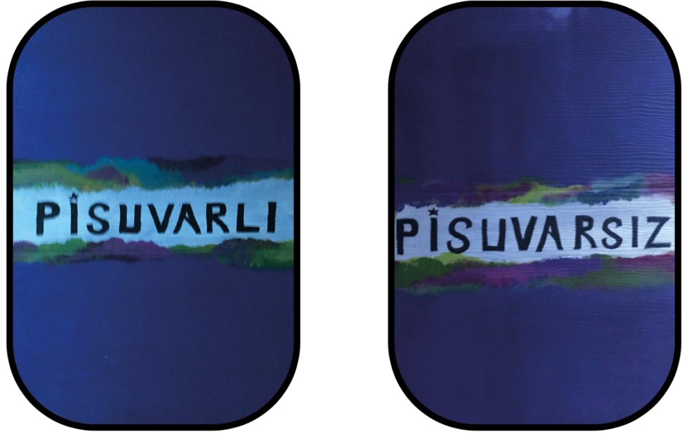
Şekil 10: Pisuarlı-Pisuarsız Olarak Tanımlanan Tuvalet Levhası