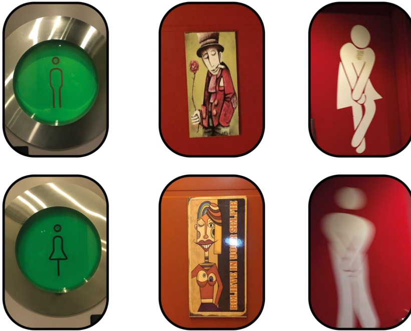
Şekil 6: Kadın ve Erkeğe Yönelik Toplumsal Normlar Üzerinden Oluşturulmuş Tuvalet Levhaları

İnce kadın bedeni ve kalın erkek bedeni ile toplumsal roller üzerine de odaklanan çizimlere rastlanmaktadır. Kırmızı gül veren ve sigara içen erkek görseli ve selfie çeken, büyük dudaklı ve göğüsleri büyük olan kadın görseli bir diğer dikkat çekici örnektir: