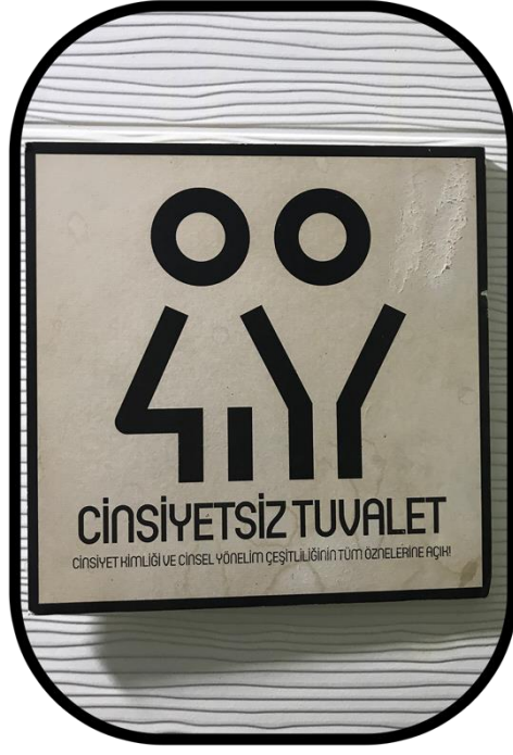
Şekil 12: Cinsiyetsiz Tuvalet İfadesi Kullanan Tuvalet Levhası

Bu noktada bir de tuvalet levhalarını belirleyenler olarak, işletme sahiplerinin algılarına bakmak da önemli olacaktır. İşletmeci görüşmeciler, tuvalet levhalarıyla ilgili şu aktarımları yapmışlardır: