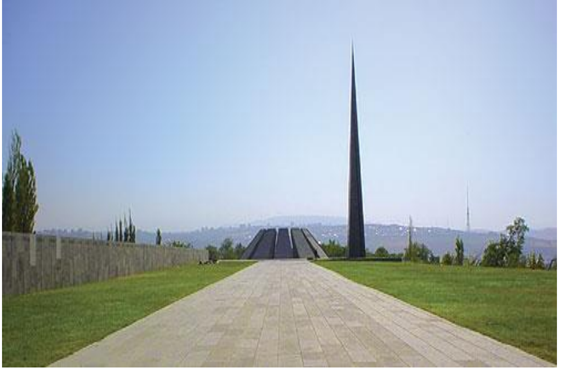
Tsitsernakaberd (kılıngıç kale) Soykırım Anıtı