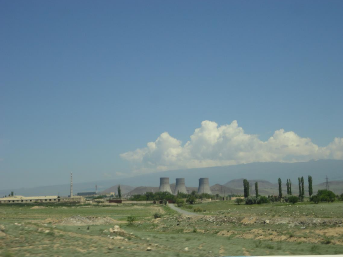
Medsamor Nükleer Santrali