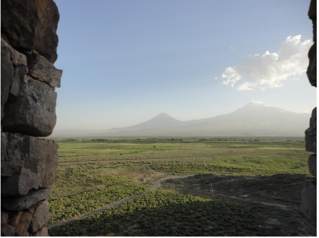
Khor Virap Manastırı'ndan Ağrı Dağı'nın görüntüsü