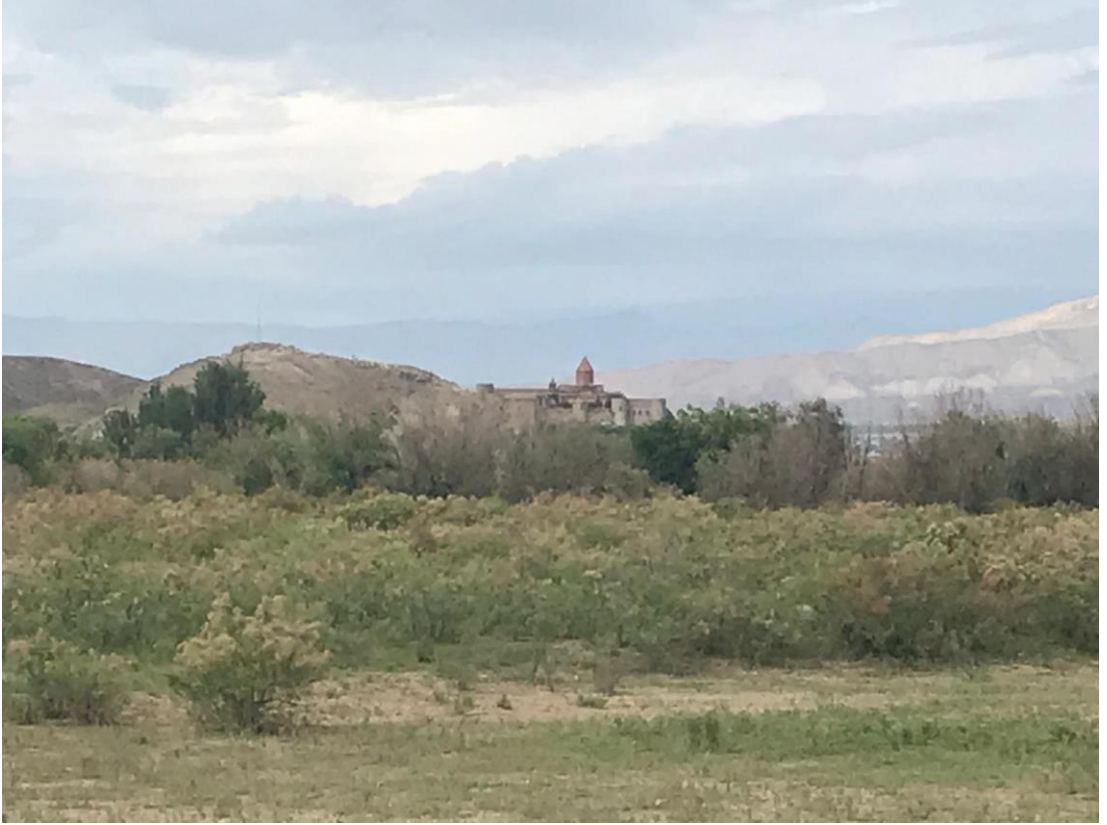
Khorvirat Manastırının Iğdır Sınır Köylerinden Görüntüsü