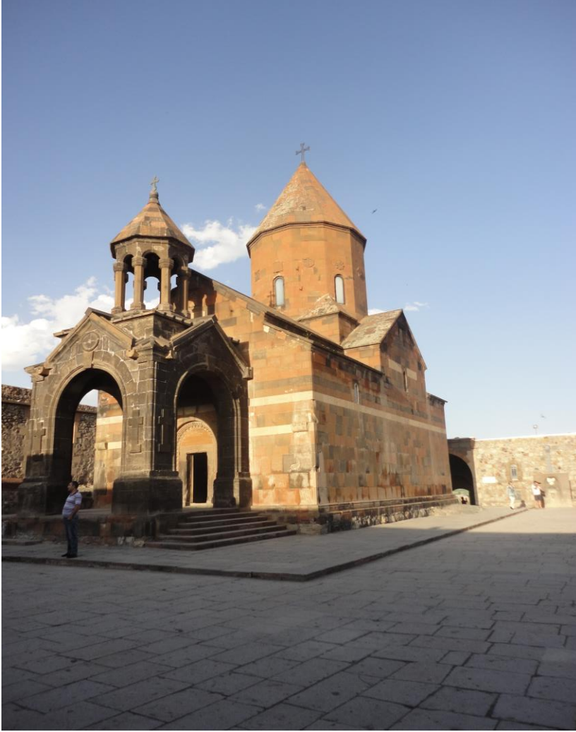
Khor Virap Manastırı, Ararat Bölgesi

Sınır bölgesi çok büyük farklılıklarla birbirinden ayrılmış değil, her iki taranda sınırın karşısında bulunan yerler görünüyor. Özellikle Ararat bölgesinde bulunan Khor Virap Manastırından birçok kişi Türkiye'ye bakmaya geliyor. Ağrıyı buradan görmeye çalışıyorlar. Türkiye tarafından Manastır Yürüme mesafesinde görünüyor.