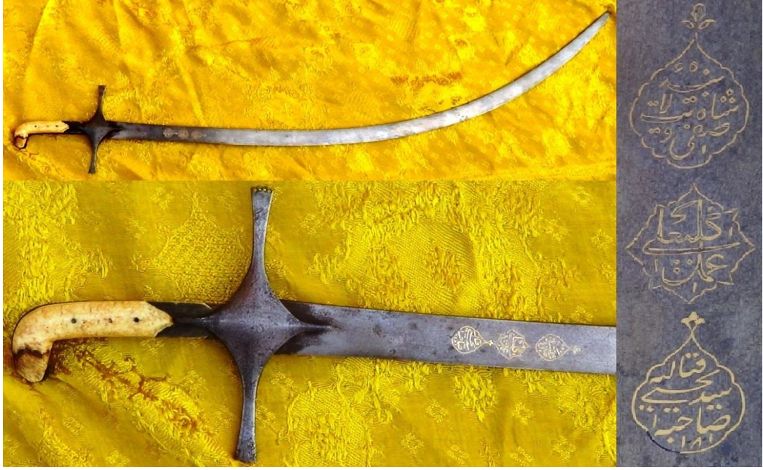
EK 3: Şah Safi'ye ait bir kılıç. 439