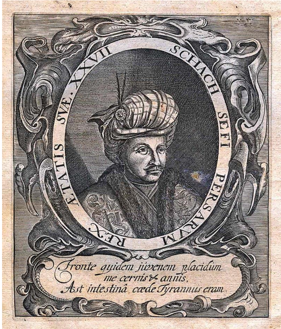
EK 1: Şah Safi'nin Portresi. 437