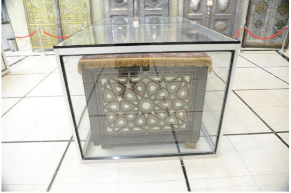
EK 2: Şah Safi'nin Kum Şehri'nde bulunan sandukasının çeşitli açılardan çekilmiş fotoğrafı. 438