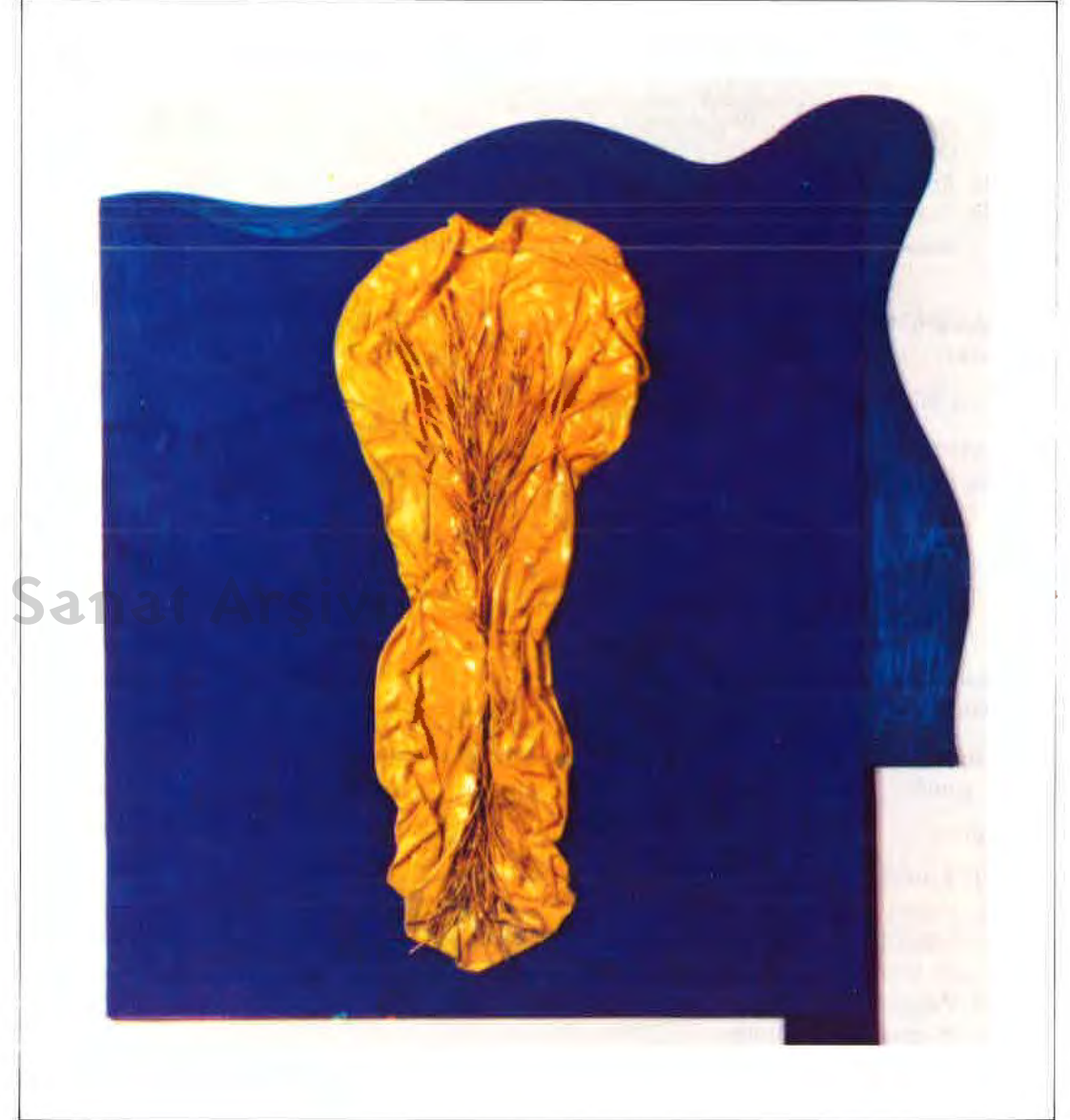
Kurt LANG "Adsız" (Kolaaj)