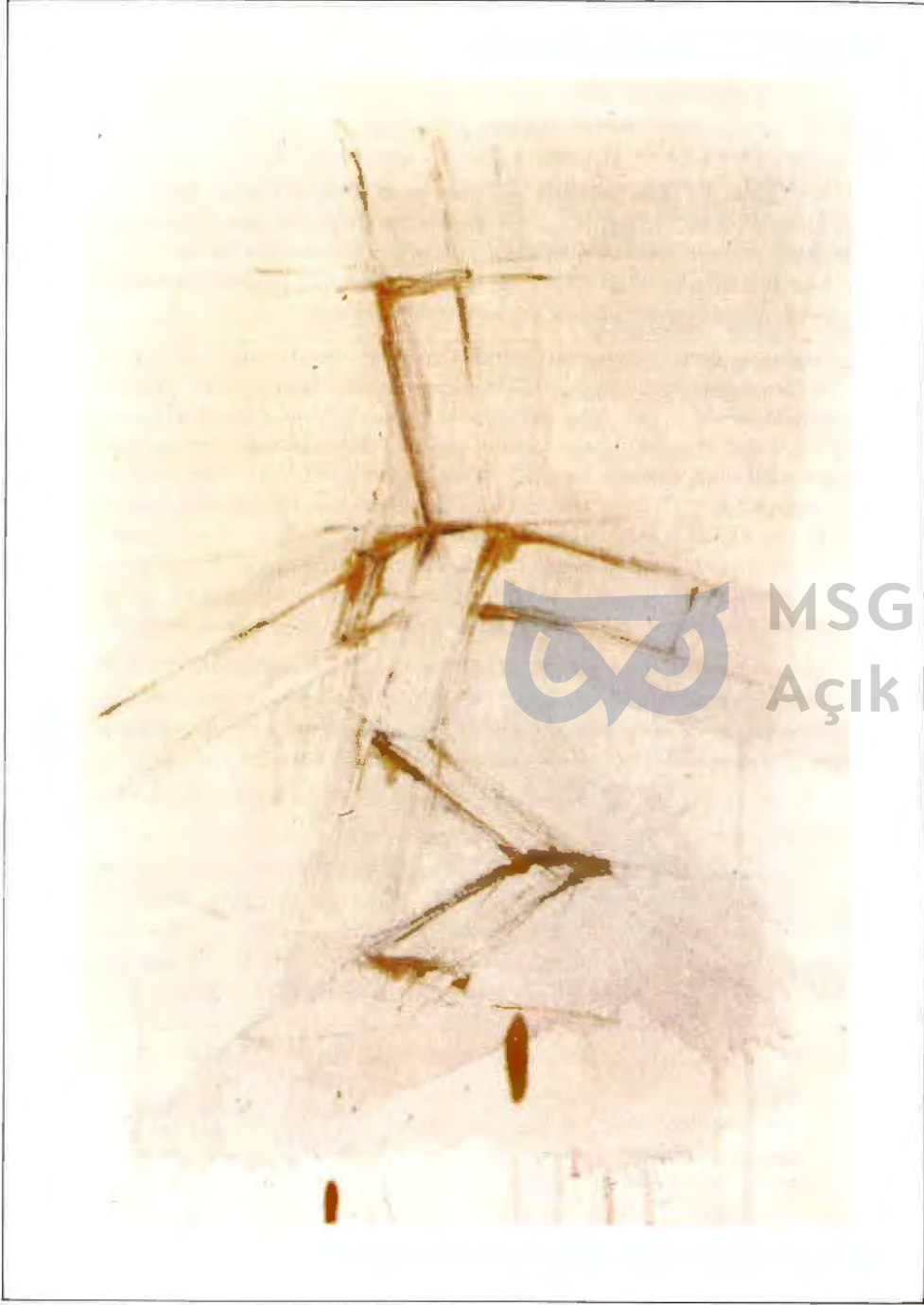
Fridolin WELTE "Asılı Çarmıh" (Kalem)