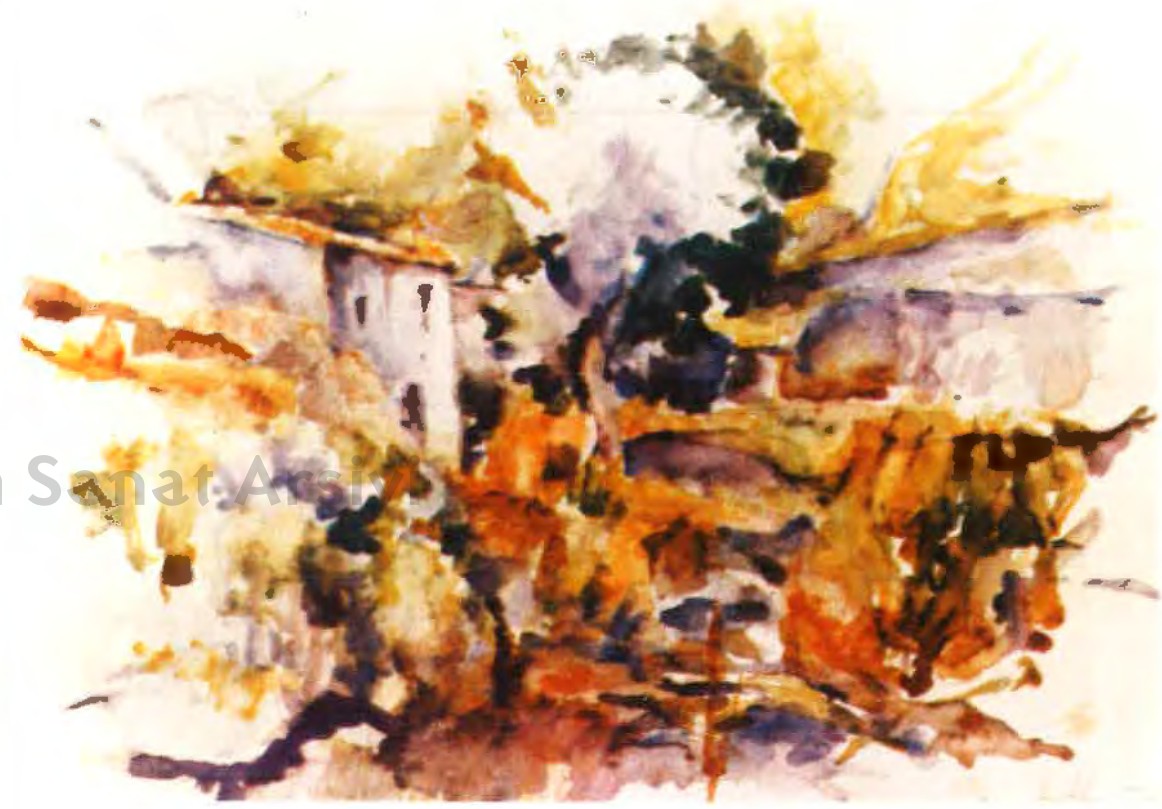
Helga AUTHRIED "Eski Ev" (Suluboya)