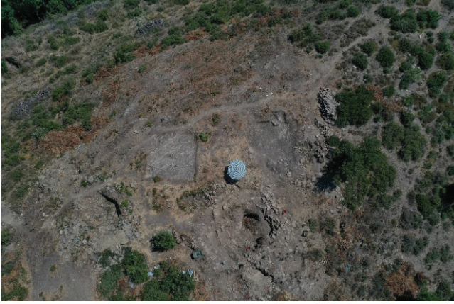
G. 2: Kazı alanının çalışmalar sırasındaki durumu (Çobankale Kazı Arşivi, 2020)