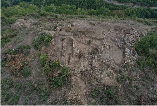
G. 3: Kazı alanının çalışmalar sonrasındaki durumu