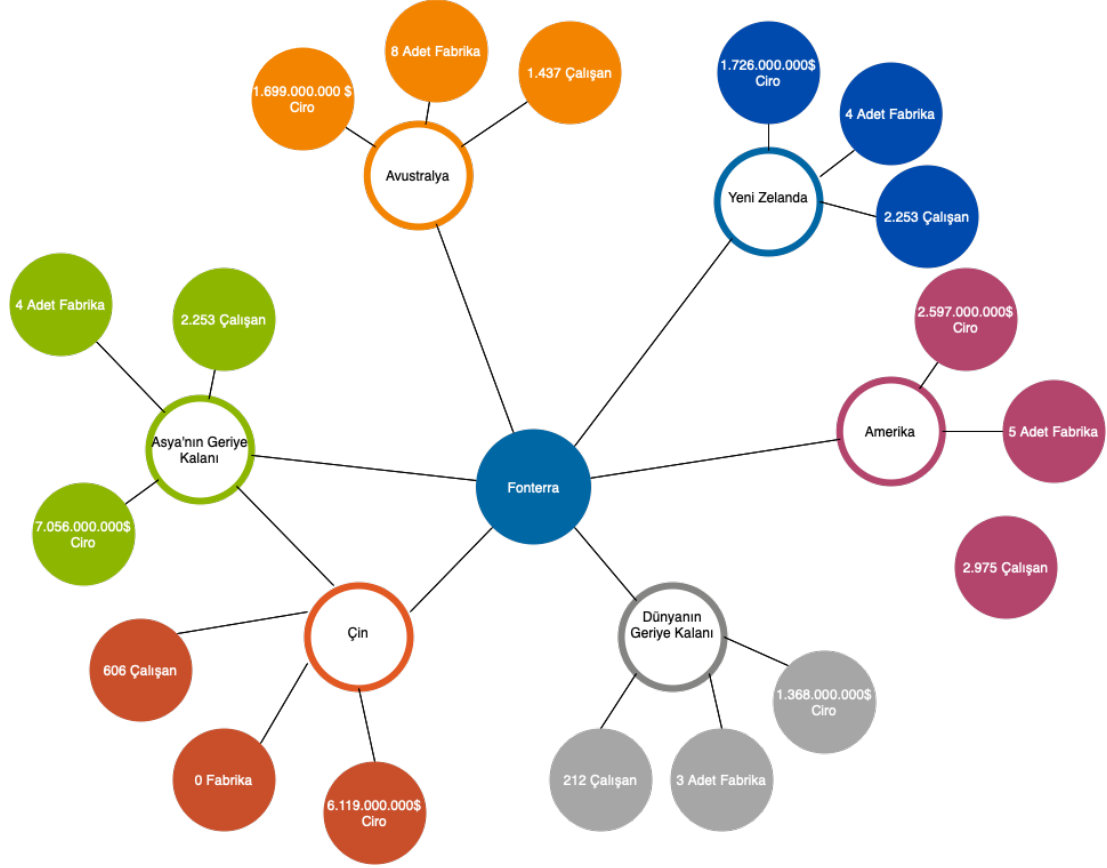
Şekil 3: Fonterra İlişkiler Ağı Diyagramı

Şekil 3'te de görüldüğü gibi Fonterra Kooperatifi bağlamında istihdamın üretim yatırımları ile doğrudan bir ilişkisi yoktur. Örneğin Avustralya'da bulunan 8 fabrikaya karşın Asya'daki Diğer Ülkelerde 4 adet fabrika bulunmaktadır. Buna karşın istihdamın 8 üretim tesisi bulunan Avustralya'nın 4 üretim tesisi bulunan Asya'daki Diğer Ülkelerin istihdam sayısının da orantılı olması beklenebilmektedir. Ancak Asya'daki diğer ülkelerin çalışan sayısı Avustralya'daki istihdama katılanların 1,5 katıdır. Fonterra örneğinde istihdam üretim tesisi ile doğru orantılı olmamaktadır.