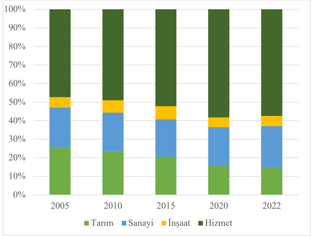
Grafik 1: 5'er Yıllık ve Günümüz İstihdamın Sektörel Dağılımı