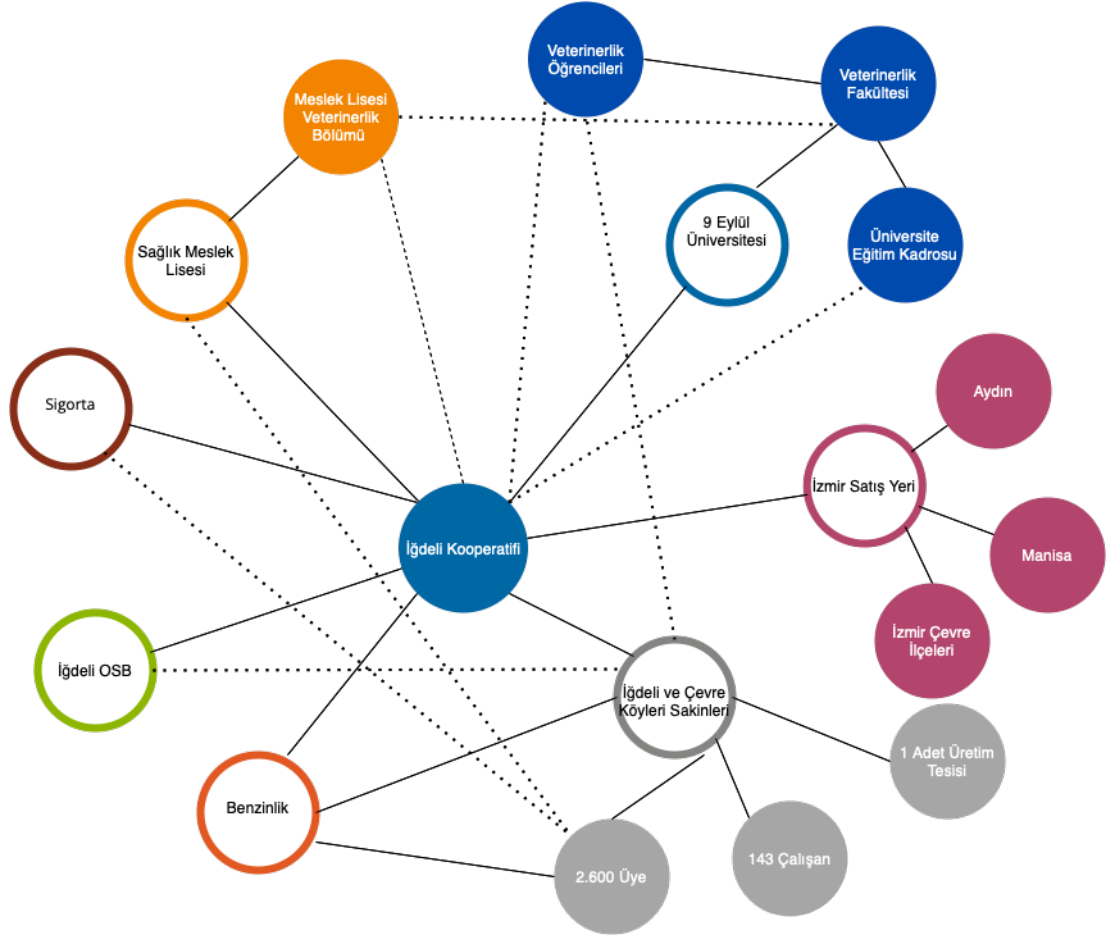
Şekil 5: İğdeli Çevre Köyleri Kalkındırma Kooperatifi İlişkiler Ağı Diyagramı

İğdeli Çevre Köyleri Kalkındırma Kooperatifi satış ağını İzmir merkezli Ege Bölgesi'nde kurmuştur. İzmir'deki satış yeri vasıtası ile çevre il (Aydın ve Manisa) ve ilçelere sevkiyatlarını gerçekleştirmektedir. Kır ile kent ilişkisi il ölçeğinde tanımlanmıştır.